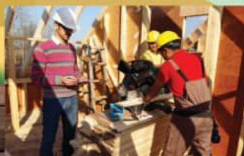
• خانه چوبی ۸۰ متری