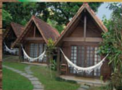
• سونیت های اقامتی توریستی

– استفاده از چوب فرآوری شده و ضد موربانه و حشرات موذی